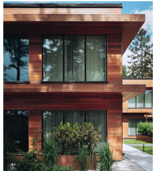
Inspirerande miljöer fyllda av mönster, färg och form som tar dig till 60-talets Palm Springs.

närmsta granne ger en rogivande atmosfär, tar de säsongsbaserade smakerna som serveras av den internationella personalen dig på en spännande resa till världens hörn. Hela upplevelsen på Ellery är så olik allt annat i Stockholm. Det är nog det som lockar till skärgårdens Cali.