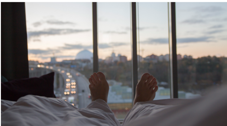
Clarion Hotel Stockholm – en perfekt bas för den som vill uppleva huvudstaden.

En levande stadsdel i huvudstadens hjärta med kvarter kända för trendiga vinbarer, lokala bryggerier och stilfulla konstgallerier. Så beskrivs populära Södermalm. Här hittar du också Clarion Hotel Stockholm! Som gäst kan du kombinera Söders kreativa atmosfär med hotellets upplevelser som bjuder på varma bad, livemusik och latinamerikanska smaker. AV EMELIE HÖGSTEDT