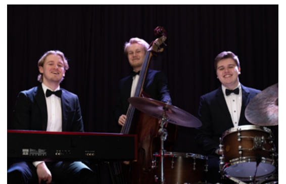
Livemusik varje lördag i Clarions Living Room.

Håll utkik på Instagram @clarionstockholm för senaste nytt.