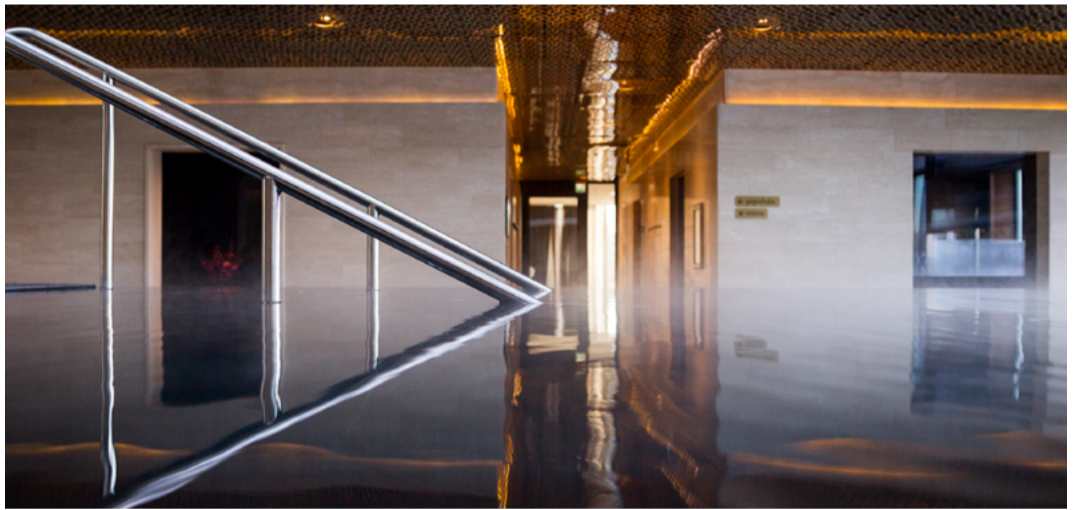
Elements Spa – här kan du hitta ditt rätta element, må bra och bara vara.

Clarion Hotel på livfulla Södermalm är ett fantastiskt läge både för dig som affärsresenär eller weekendgäst. Du är alltid nära såväl Stockholms sevärdheter som en grön park och vatten – perfekt för promenader och löpturer oavsett om du är här för jobb eller nöje.