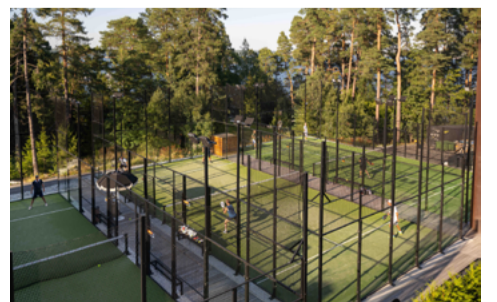
Ellery Beach House har tre padelbanor vackert belägna mellan havet och skogen.