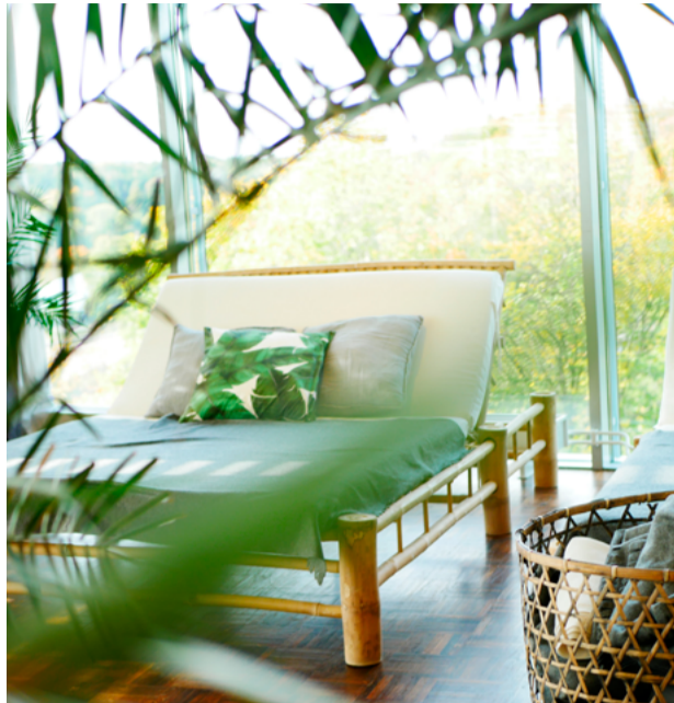
Koppla av och hitta ditt rätta element på Elements Spa.