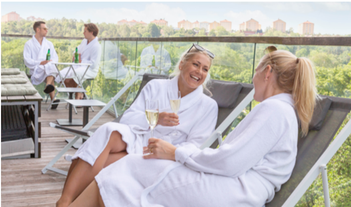
Med perfekt läge för en sommarsemester i Stockholm.

På Södermalm bor du i en levande stadsdel och har samtidigt nära till både vatten och grönska - perfekt för en powerwalk eller löptur. Granne med Clarion Hotel hittar du även Eriksdalsbadet med motionssim och äventyrsbad. På promenadavstånd från hotellet finns historiska Gamla stan och endast fyra stopp med tunnelbanan tar dig till Stockholms city.