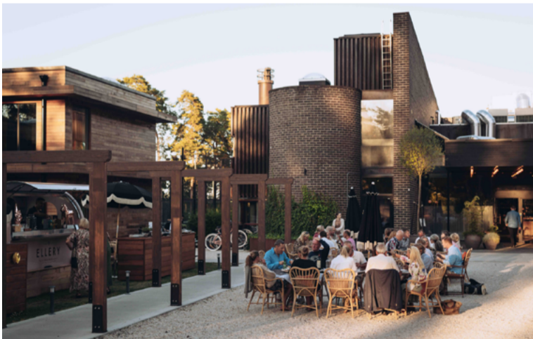
Kom över dagen - med bil eller båt - för god mat, aktiviteter och avslappning.