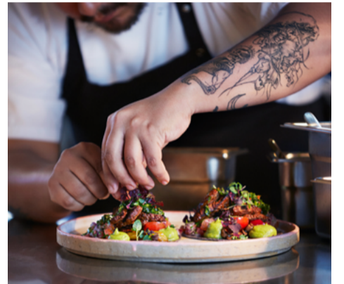
Latinamerikanska smaker på Eatery Social.

Håll utkik på Instagram @clarionstockholm för senaste nytt.